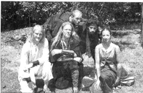
Au grand jour, les artistes.

Trois soirs de suite, les cinq jeunes de la troupe envahissent la nuit : d'abord au marché artisanal, puis sur la place du moulin, enfin dans le parc communal, trois spectacles différents où la magie du feu et de la lumière force à aimer la nuit. "L'Arche, images", conte très visuel, est une "héroïque fantaisie", ou les effets lumineux créent le rêve : danse