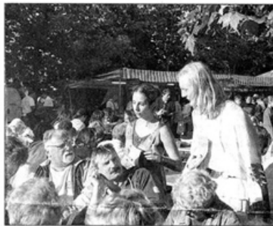
Tout au long de la soirée, les membres de la Compagnie « L'Arche en sel » ont amusé le public, le plongeant dans une ambiance médiévale.